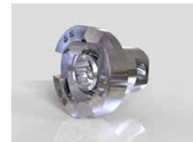
Anschluss Winkel 8141 HD GLAW